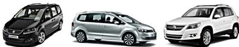
SEAT ALHAMBRA 2010> - VW SHARAN 2010> - VW TIGUAN 2010>