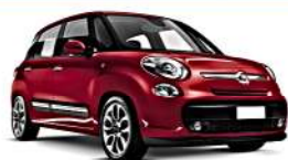
FIAT 500L 09/2012>