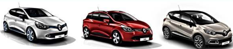
RENAULT CLIO 11/2012> - CLIO GRANDTOUR IV 01/2013> - CAPTUR 06/2013>