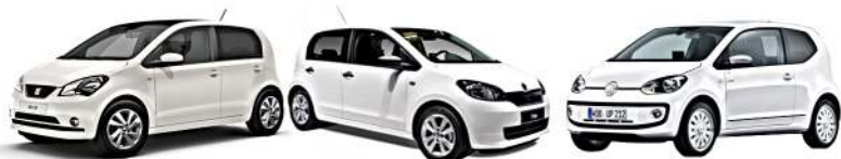
SEAT MII (KF1_) 10/2011> - SKODA CITIGO 10/2011> - VW UP 12/2011>