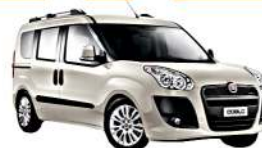
FIAT DOBLO' PANORAMA 2010