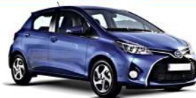
TOYOTA YARIS (NLP13_,NSP13_,NCP13_,KSP13_) 12/2012>