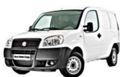
FIAT DOBLO' (01-09)